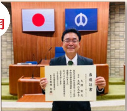
5月1日から4年間の任期が始まりました！