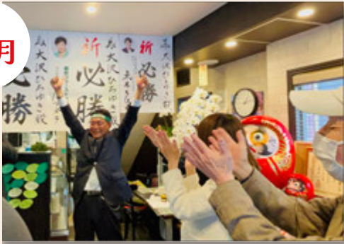
みなさまのお力添えで議席を頂きました！