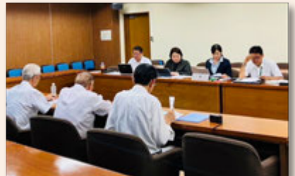
区内団体から予算要望をお聞きしました。10月に区への要望書として区長に提出しました。